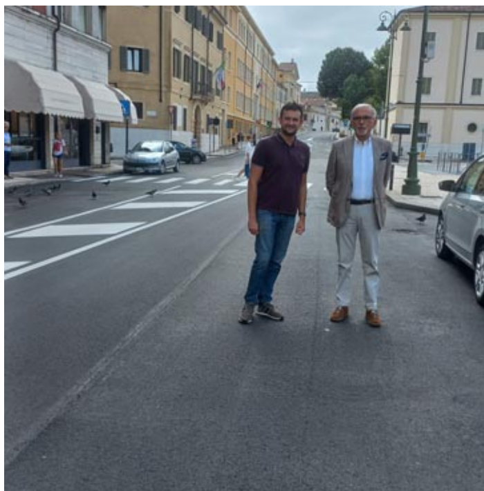
Un momento del sopralluogo

A Veronetta si è intervenuto su via Interrato dell'Acqua Morta, nel tratto tra i giardini della Giarina e l'incrocio con Via Ponte Pignolo; Via Sauro prima della galleria, Lungadige Porta Vittoria, via Mazza. In partenza poi un piano ad hoc per sistemare il porfido in centro storico, piano per il quale vengono stanziati 150 mila euro.