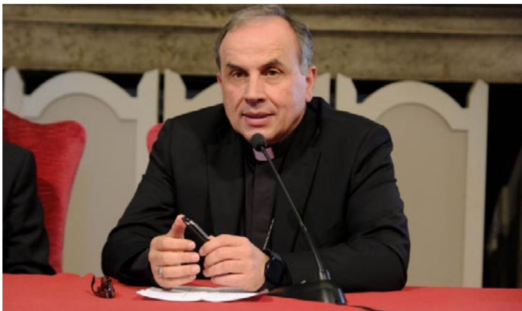
Il vescovo Domenico Pompili

In continuità con la visita di papa Francesco per l'Arena di Pace del maggio scorso, la Fondazione Toniolo della diocesi di Verona, con il sostegno di Fondazione Cattolica e Generali Italia e la sua divisione Cattolica, promuove dal 17 al 20 ottobre 2024, la rassegna di eventi Poeti Sociali. L'espressione è di papa Francesco e si riferisce ad opere, testimonianze e prassi che raccontano «esperienze e iniziative generative (poiesis) che sanno creare speranza laddove appaiono solo