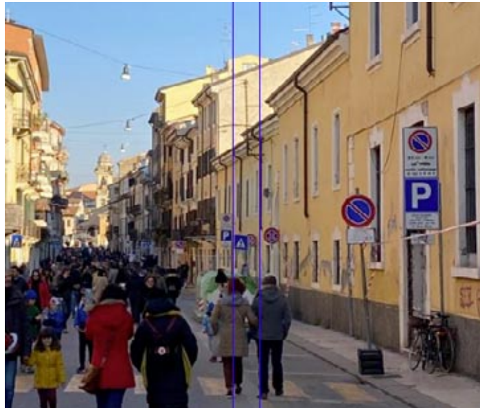
Via XX Settembre sarà una grande area pedonale

Divieti di transito: fino alle 24 del 15 settembre in via XX Settembre, da corso Venezia a via dell'Artigliere; via San Nazaro, da Largo San Nazaro a via XX Settembre; largo San Nazaro; vicolo Porta Vescovo; piazza XVI Ottobre; salita Santo Sepolcro, da via XX Settembre a via Caroto e dalla medesima a via Alto San Nazaro; via Barana, da salita San Sepolcro a via Rosa Morando; via Alto San Nazaro; vicolo Terrà, da via XX Settembre a via